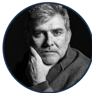
ÀNGEL ÒDENA Barítono Tarragona, España