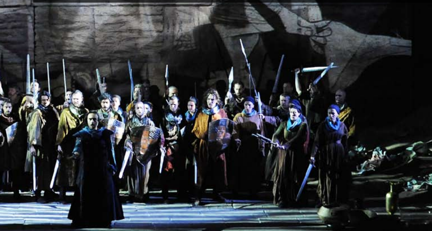
La producción de I lombardi que se verá en Bilbao proviene del Teatro Regio de Parma y lleva la firma del director de escena Lamberto Puggelli

atractivo a ojos actuales, además es muy difícil de cantar para los solistas y exige dos tenores y una soprano de primera calidad. Es una pena que no se haga mucho, porque tiene páginas muy interesantes. Diría que es un Verdi experimental, pero creo que incluso Roberto Devereux de Donizetti es más moderno en algunos aspectos, aunque es innegable que en I lombardi ya se revela el gran Verdi de madurez. Su orquestación ofrece un color muy peculiar y definido. Los instrumentos de viento y metal se están transformando y en pleno desarrollo. I lombardi es un título óptimo para hacerlo con instrumentos originales afinados a 435 hz para entender mejor cómo se concibió en su momento —como hacemos con ciertas obras en el Festival Donizetti de Bérgamo—, aunque no soy partidario de eliminar los agudos impuestos por la tradición porque siempre se han hecho, al igual que las variaciones”. □